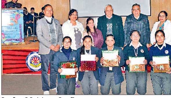
भिवानी। अतिथियों के साथ विद्यार्थी।