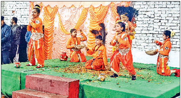
भिवानी। लोहारू की श्रीगोपाल गोशाला में वार्षिकोत्सव में प्रस्तुति देते विद्यार्थी व प्रतिभागियों को सम्मानित करते कृषिमंत्री जेपी दलाल व अन्य।