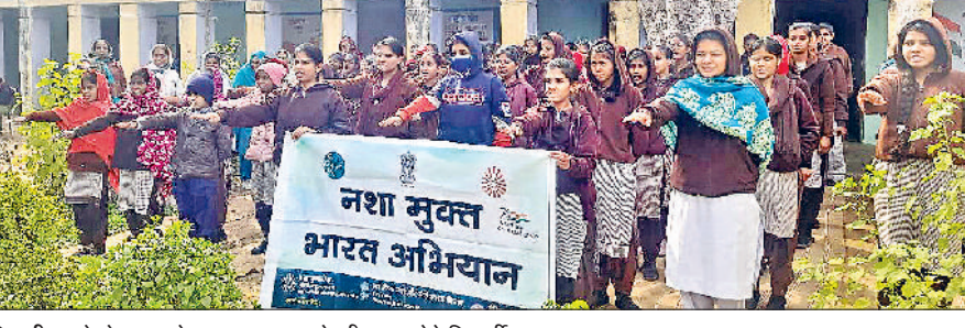
भिवानी। नशे से दूर रहने व जागरूक करने की शाय लेते विद्यार्थी।

नशा दीमक की तरह है, जो धीरे-धीरे शरीर को अंदर से खोखला करता है, जिसकारण व्यक्ति शारीरिक और मानसिक रूप से कमजोर होकर अनेक भयानक बीमारियों से पीड़ित होने लगता है, ये उच्च प्रजापिता ब्रह्माकुमारी ईश्वरीय विश्वविद्यालय एवं केंद्र सरकार द्वारा संयुक्त रूप से चलाए जा रहे नशा मुक्त भारत अभियान के अंतर्गत ब्रह्माकुमारी शाखा कादमा के तत्वावधान में मेरा गांव नशा मुक्त गांव अभियान के अंतर्गत तीसरे दिन राजकीय कॉलेज, आईटीआई, राजकीय कन्या वमा