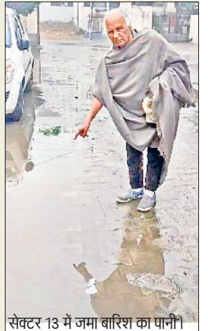
सेक्टर 13 में जमा बारिश का पानी।