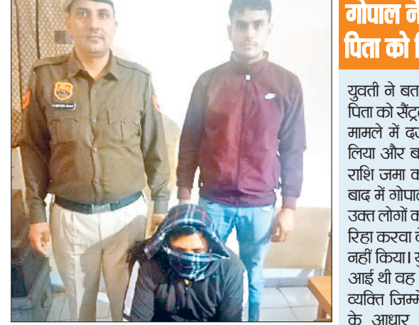
भिवानी। पुलिस हिरासत में धोखाधड़ी की राशि डलवाने का आरोपी।