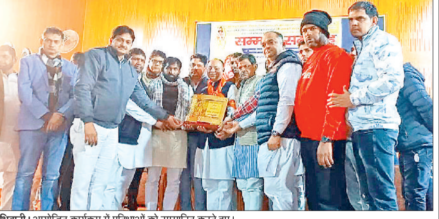
भिवानी। आयोजित कार्यक्रम में प्रतिभाओं को सम्मानित करते हुए।