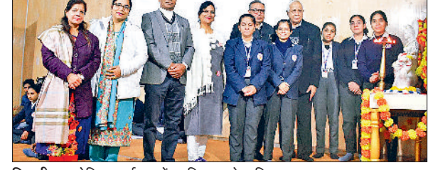
भिवानी। आयोजित कार्यक्रम में उपस्थित बच्चे व शिक्षक।